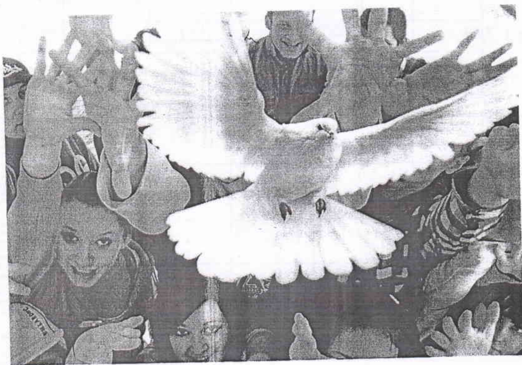
г. Моздок, 2020 г.

Будущее мира за новыми поколениями. Так давайте сделаем, чтоб этот мир был полон тепла и любви. Это отчасти в наших руках! В руках каждого!